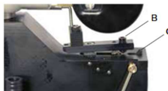
Abzug Bobcat, Verminator, Rancho und Streamline